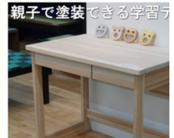
親子でDIY楽しめる国産杉の学習デスク